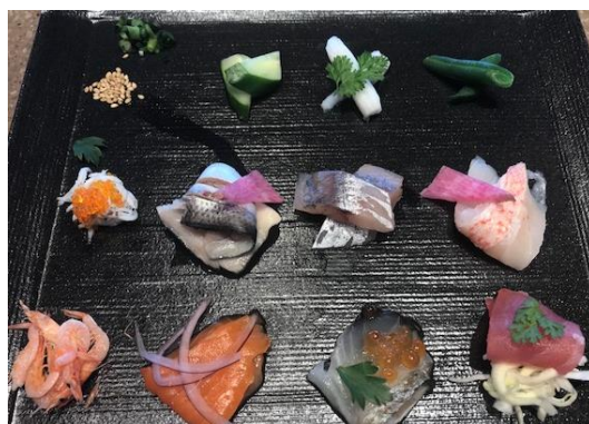
(手織り寿司イメージ)