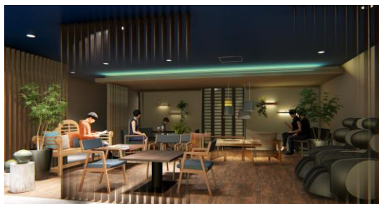
(ラウンジルームイメージ)