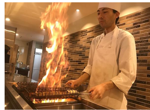
(炎の薫焼きイメージ)