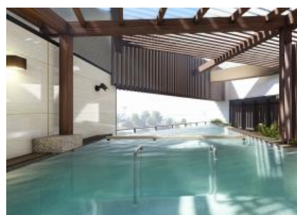
(露天風呂イメージ)