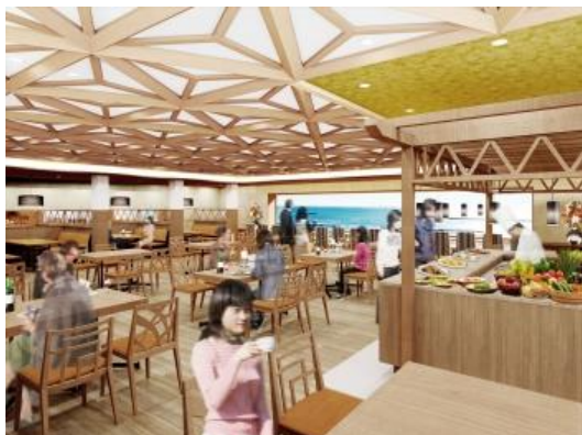
(メインダイニングイメージ)

が撮りたくなること間違いありません。さらに夕食時はライトアップされたサンビーチを、朝食時は朝日にきらめく相模湾を一望できる窓側の席はすべてカウンター席となっており、おひとり様でも気軽にご利用いただけます。