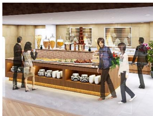
(ブッフェテーブルイメージ)