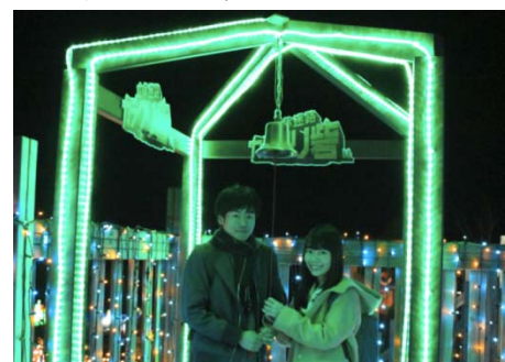
カラクリ砦頂上のイルミネーション