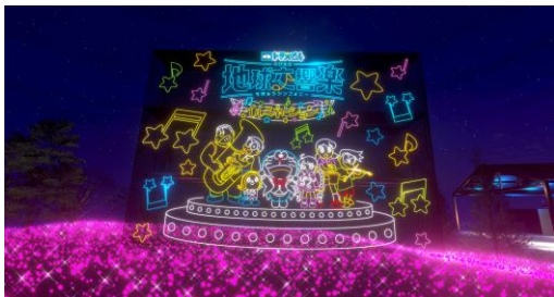
ゲストをお出迎えする巨大なイルミネーションアートウォール