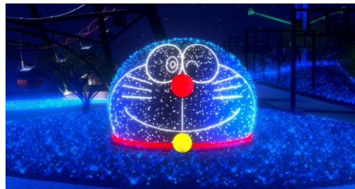
まあるいドラえもんの顔を半球体型のバルーンで表現したアイコン的なイルミネーション