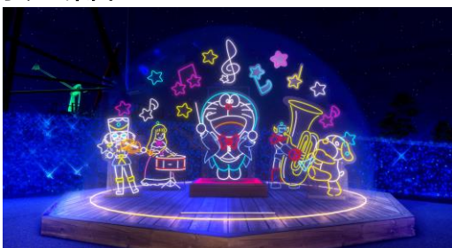
おもちゃの楽団と一緒に、ドラえもんが楽しく演奏する様子のイルミネーション