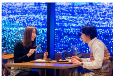
レストラン「ワイルドダイニング」

園内中心部にあるレストラン「ワイルドダイニング」では、イルミネーションの幻想的な景色とともに温かい料理を楽しめるほか、日帰り温泉施設「さがみ湖温泉うるり」も隣接しており、“イルミネーション”と“温泉”という冬の醍醐味を満喫することができます。隣接するアウトドア施設「PICA さがみ湖」では、BBQや焚火、宿泊もでき、1日を通して丸ごと遊園地を楽しむことができます。